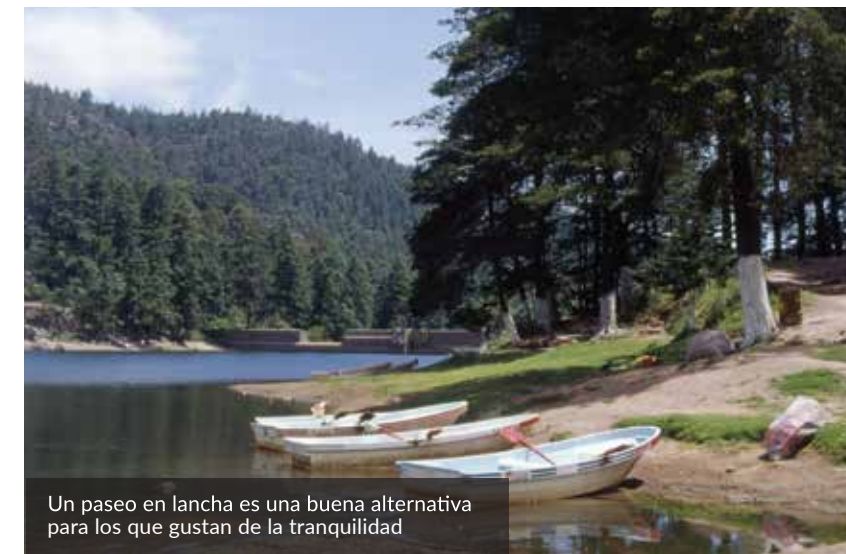
Un paseo en lancha es una buena alternativa para los que gustan de la tranquilidad