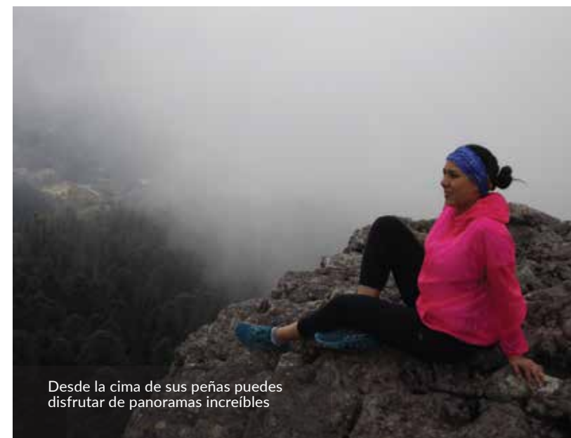
Desde la cima de sus peñas puedes disfrutar de panoramas increíbles

Para mayor información. Km 7.5 Carretera Casas Quemadas a Mineral del Chico, Municipio Mineral del Chico, Hidalgo Tel. 01 (771) 596-1314 www.gob.mx/conanp