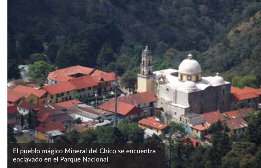
El pueblo mágico Mineral del Chico se encuentra enclavado en el Parque Nacional

Belleza escénica que forma parte de la identidad regional