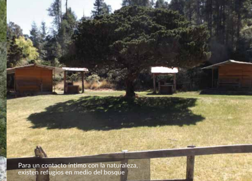
Para un contacto íntimo con la naturaleza, existen refugios en medio del bosque