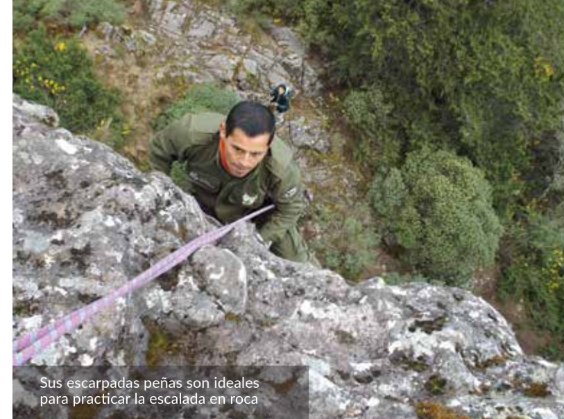
Sus escarpadas peñas son ideales para practicar la escalada en roca

Asentado en el Parque Nacional se encuentra el pueblo mágico Mineral del Chico que mantiene un rico patrimonio cultural en sus haciendas mineras, templos religiosos, casas típicas, calles y plazas; por lo que en esta área convergen turismo cultural y turismo de naturaleza de forma armónica.