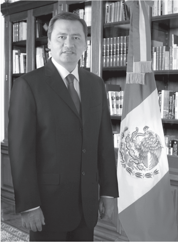
Miguel Ángel Osorio Chong Gobernador Constitucional del Estado de Hidalgo