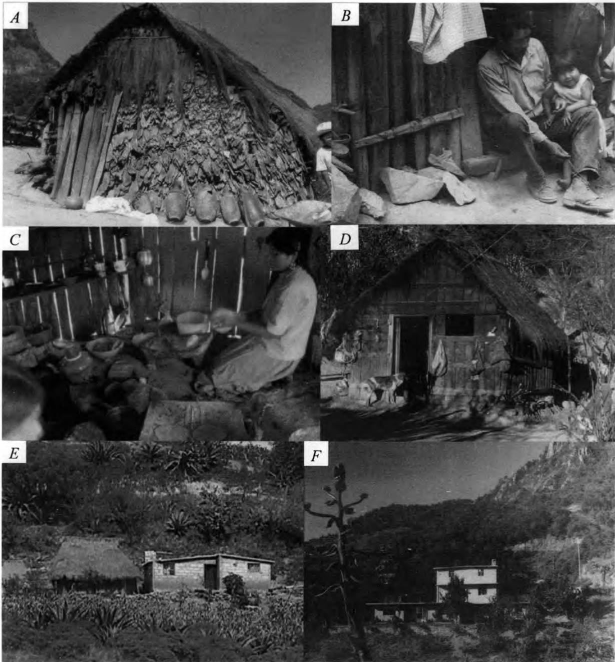
Figura 8. Evolución de las casas en Gundhó. A. Pared de penca de maguey y puerta de postes (1972), B. Detalle de casa con palos atados con xixi (1970), C. Interior de una casa construida con palos y tablas (1973), D. Tablas clavadas a barras horizontales (1975), E. Casa vieja de palos y techo de pasto adyacente a otra construida de tabicón, F. Casa de tabicón de tres niveles, donde se observa un quiote a la izquierda, lo cual significa que no están raspando el maguey (1999).