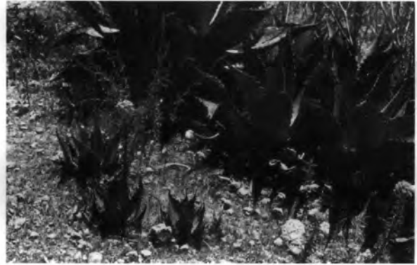
Figura 3. En el mbanga itá los propágulos se originan de rizomas, un poco más lejos que en otras variedades, de la base de la planta parental.