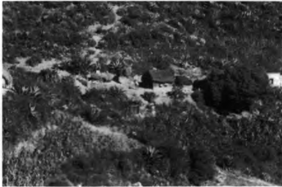
Figura 2. Casa con magueyes y milpa, en Gundhó.