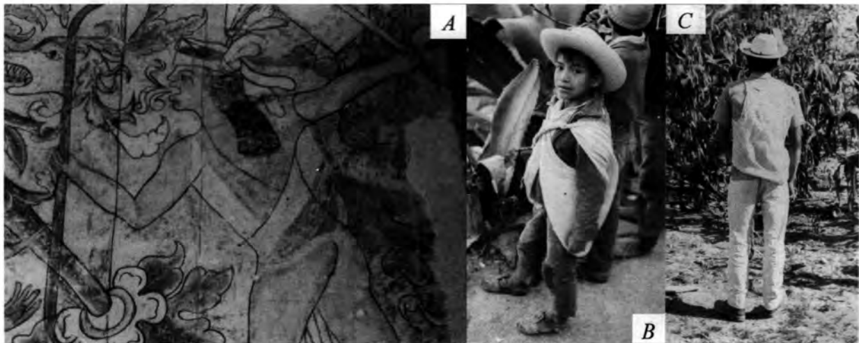
Figura 5. Camisa de ayate en un mural del siglo XVI en Ixmiquilpan (A). Vistas frontal (B) y dorsal (C) de la camisa de ayate usada por habitantes de Gundhó.