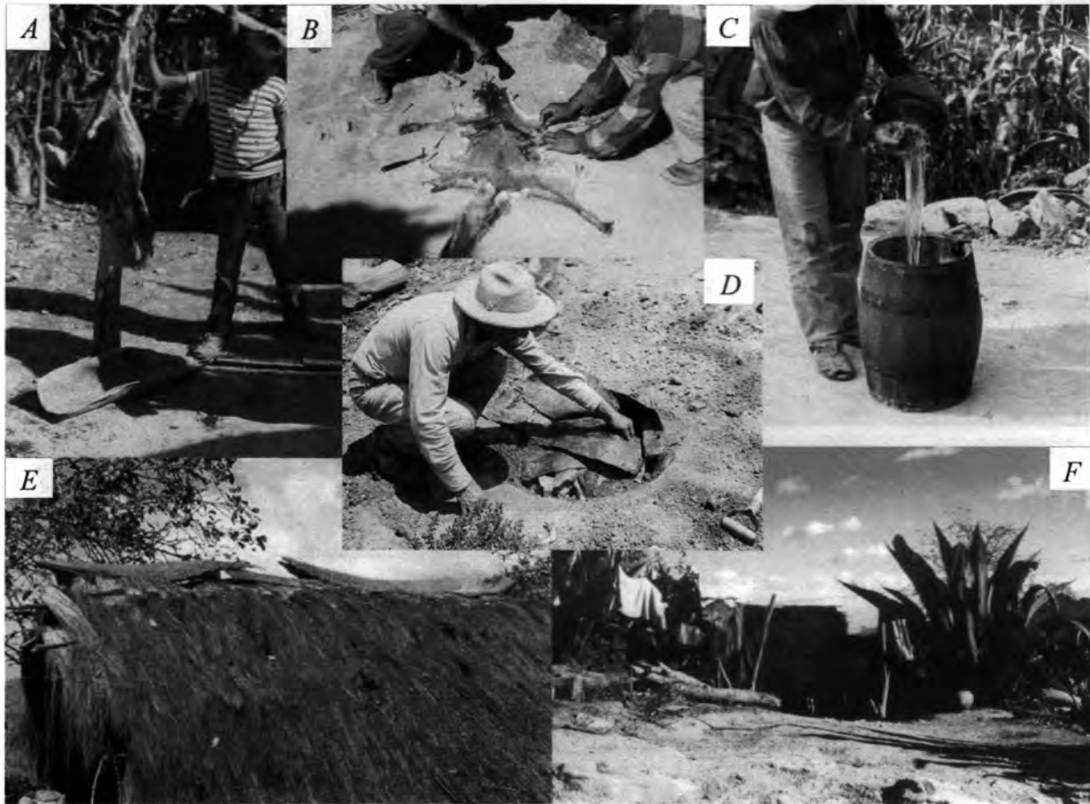
Figura 4. Varios usos del maguey: penca como charola (A), espinas como tachuelas para extender la piel del zorro (B), fibra para colar aguamiel (C), pencas para hacer barbacoa (D) y reparar techados (E), planta como tendedero para ropa y anaquel para varios utensilios (F).