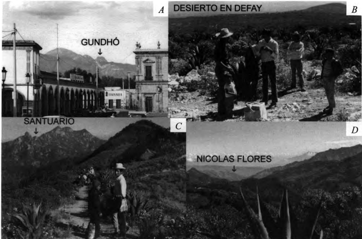
Figura 1. A. Ubicación de Gundhó visto desde Ixmiquilpan. B. Pobladores subiendo los cerros a pie desde el desierto en Defay (1971). C. Por el camino a Gundhó. La comunidad Santuario, municipio de Cardonal, se sitúa al oriente. D. La población de Nicolás Flores se localiza en la parte norte del valle.