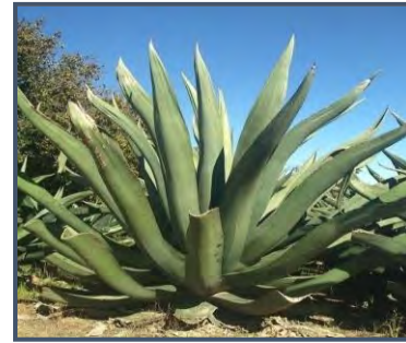
g) maguey ayoteco