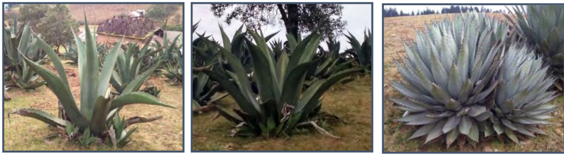
a) maguey blanco