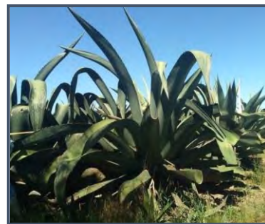
e) maguey chalqueño