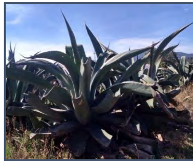
d) maguey manso