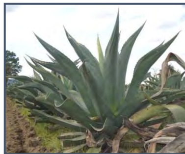
f) maguey púa larga