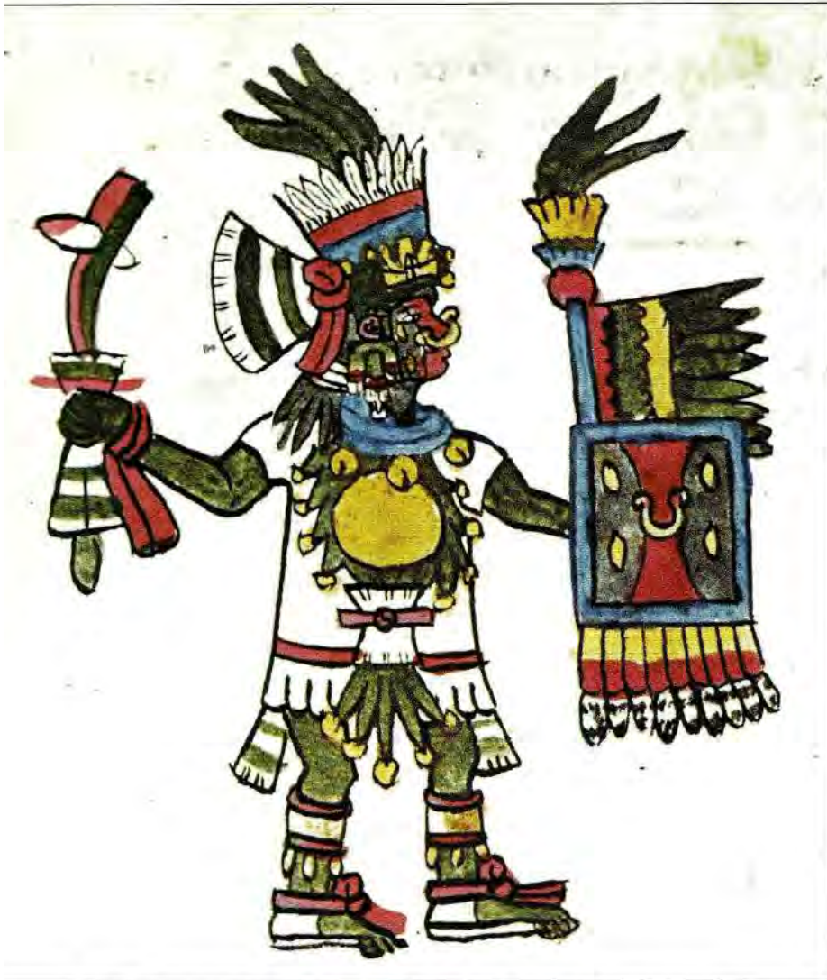
5. Toltécatl era uno de los "400 dioses del pulque". Códice Tudela , f. 34r.

tecimiento, los dioses tuvieron que abandonar el paraíso de Tamoanchan. La transgresión puede ser entonces de índole sexual, o bien puede consistir en emborracharse y desnudarse, como en el caso de Cuextécatl.