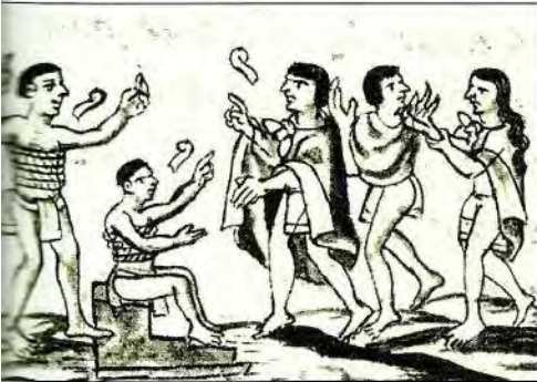
9. Tezcatlipoca, a la izquierda, como chalca ebrio, anuncia a los enviados de Motecuhzoma la destrucción de México-Tenochtitlan. Códice Florentino , lib. XII, f. 18v.

cubrieron y la hicieron pedazos. Quetzalcóatl recogió los huesos de la diosa y los enterró. De ellos nació el maguey del cual se hace el pulque.