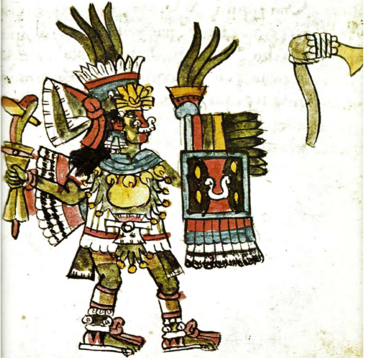
1. Tepoztécatl, uno de los "400 conejos", era dios del pulque de Tepoztlán. Códice Magliabechiano , f. 49r.