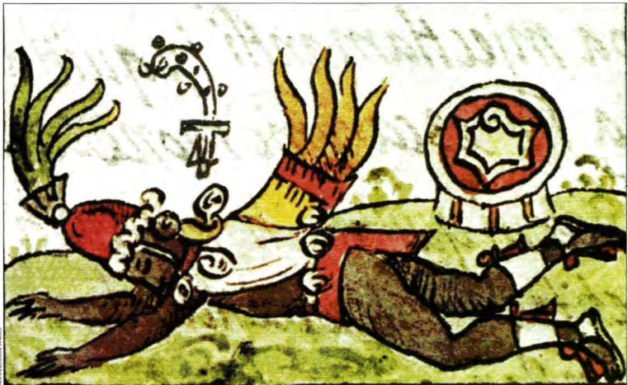
4. Tezcatlipoca engañó a Quetzalcóatl, rey-sacerdote de Tollan, para que se embriagara. Códice Florentino , lib. III, f. 22r.