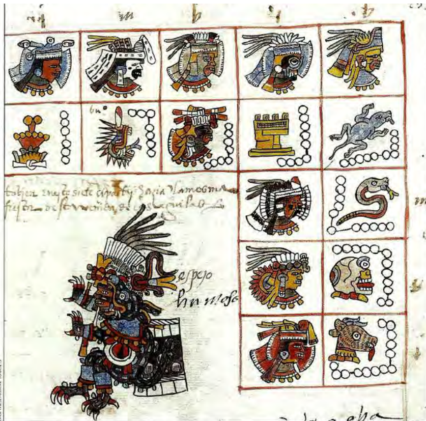
7. Tezcatlipoca —con disfraz de animal (¿coyote?)— figurado como el transgresor por excelencia de Tamoanchan. Códice Telleriano-Remensis, f. 23r.