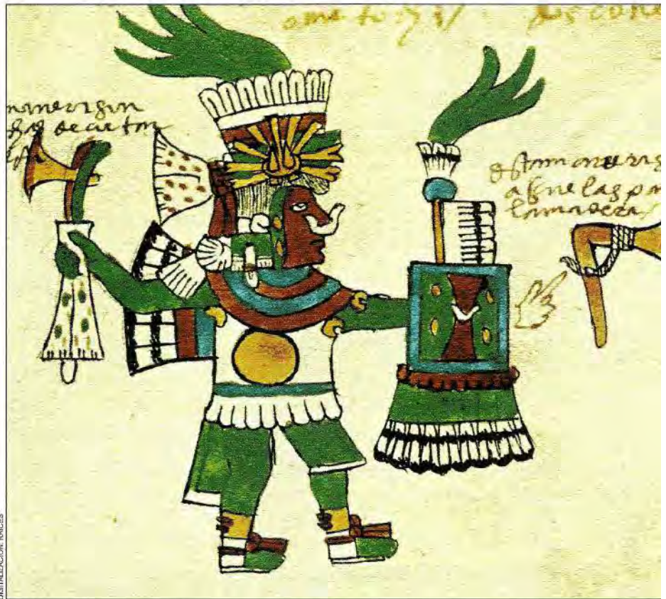
10. Sacrificado por Tezcatlipoca, Ome Tochtli—dios del pulque—renació poco después. A partir de este sacrificio, los hombres podrían tomar pulque sin riesgo de morir. Códice Tudela , f. 31r.