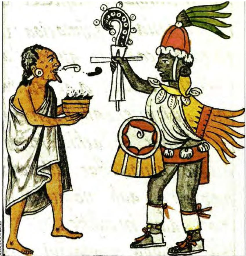
3. Tezcatlipoca, como anciano, ofrece "medicina", en realidad pulque blanco, a Quetzalcóatl. Códice Florentino , lib. III, f. 12r.

Existen varias versiones de la expulsión de Tamoanchan de dioses o de personajes como Cuextécatl. Tezcatlipoca es el principal culpable, ya que fue él quien sedujo a una diosa llamada Xochiquétzal, Tlazoltéotl o Cihacóatl en Tamoanchan (fig. 7). Después de este acontecimiento,