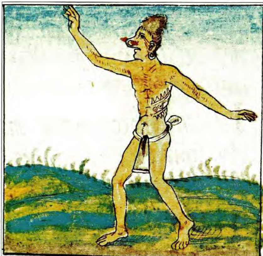
8. Por razones míticas, los nahuas consideraban que los huastecos eran unos borrachos empedernidos. Códice Florentino, lib. IX, f. 50r.

dios cuya era se termina frente al nuevo Sol Quetzalcóatl. Su ebriedad se inscribe perfectamente en los esquemas de fin de era que acabamos de describir.