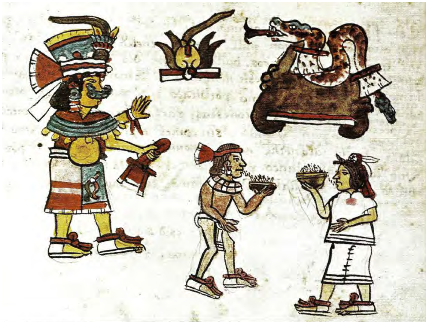
2. Durante la fiesta de huey pachtli , dedicada a la diosa Xochiquétzal, tenía lugar la ceremonia llamada pillahuanaliztli , "embriaguez de los niños". Códice Magliabechiano, f. 41r.

existía una reprobación social en contra de los borrachos e incluso algunas leyes que los castigaban, lo cual parece contradecir lo que acabamos de afirmar en cuanto a la falta de responsabilidad de la persona ebria. Sea como fuere, la ingestión de pulque estaba estrictamente reglamentada y sólo era permitida a las personas de más de 52 años, a los miembros de la elite en ciertas circunstancias y a la gente común durante algunas fiestas (fig. 2).