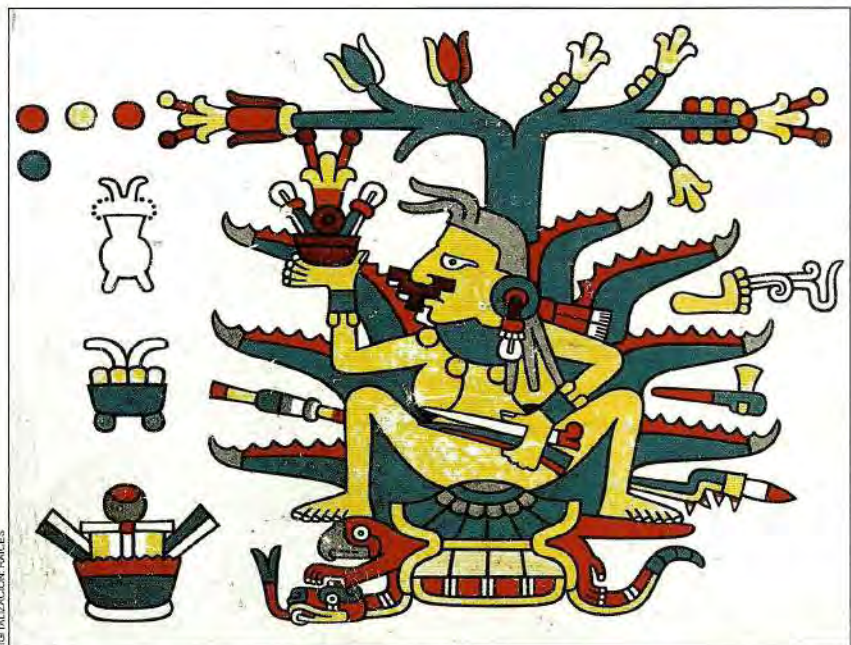
11. Mayahuel, diosa del maguey, fue muerta por las tzitzimime antes de transformarse en maguey. Códice Laud , p. 16.