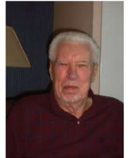
William Bunge 1928