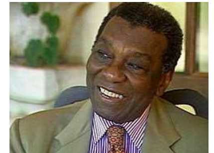
Milton Santos 1928-2001