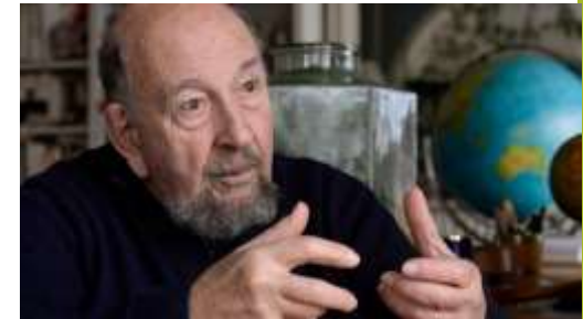
Yves Lacoste 1929

Obras: Geografía del subdesarrollo (1965), La Geografía: un arma para la guerra (1976), Geopolítica. La larga historia del presente (2006), Diccionario de Geopolítica (1995).