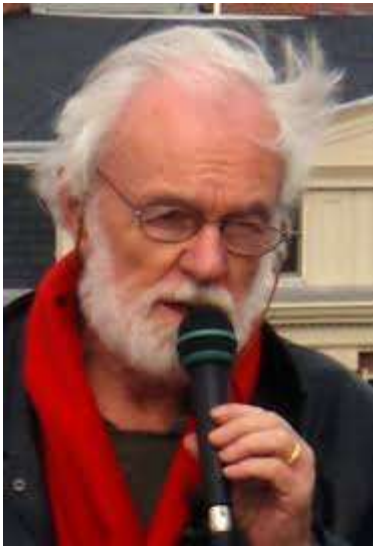
David Harvey 1935

David Harvey. Es uno de los geógrafos más conocidos e influyentes en la actualidad.