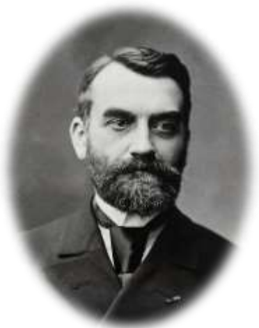
Paul Vidal de la Blache

Padre de la geografía regional, de tipo posibilista en contra del determinismo alemán, Sorbona.