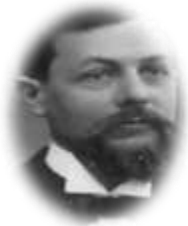
Emmanuel de Martonne

Padre de la geografía regional, de tipo posibilista en contra del determinismo alemán, Sorbona.